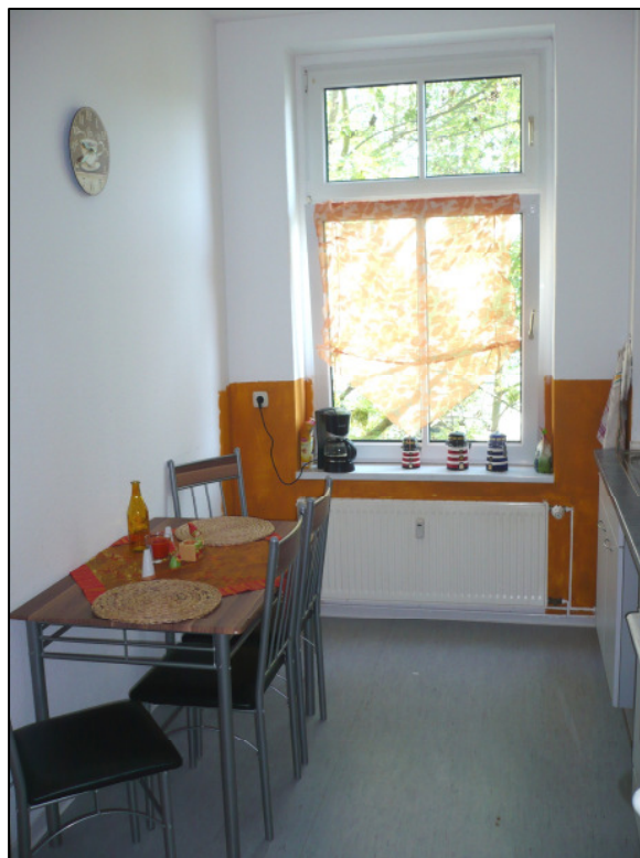
Küche mit Essecke